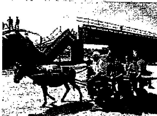
הסיוע ההומניטרי שבמתחתנו לא יספיק אפילו לשבוע

אותן משלחות ערביות אמרו גם בפגישה עימם שההצלחה היא שנראה את רצועת עזה מהים. חלק נכבד מההצלחה, לטענתם, הוא היחזמה לצאת במשט. אך החלק המשמעותי ביותר בהצלחה הוא שנפליג ונראה את עזה. הם אמרו גם שהסיוע ההומניטרי העומד על מיליוני דולרים, לא יספיק לעזה אפילו לשבוע אחד. מה שחשוב, לדבריהם, הוא שנעביר מסר של חיזוק לתושבי עזה ולגייס את דעת הקהל העולמית סביב משא המצור.