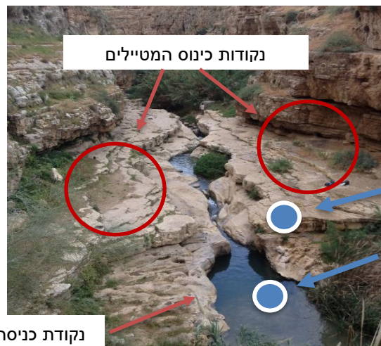
נקודת כניסה לבריכת הרחצה