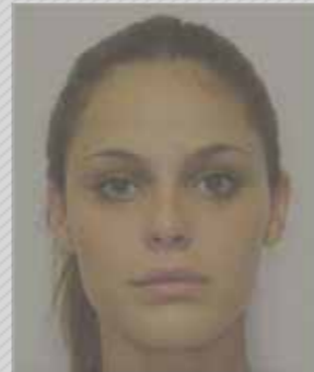
✗ חוסר ניגודיות