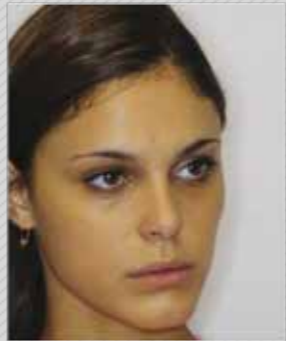
✗ מבט לצד