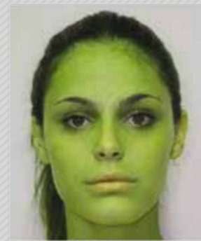
✗ צבע לא טבעי