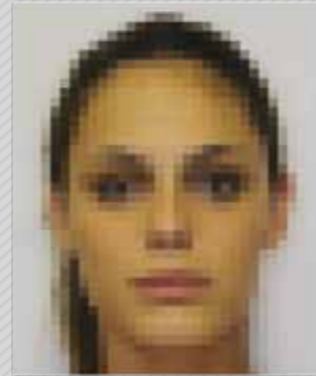
✗ אבחנה נמוכה