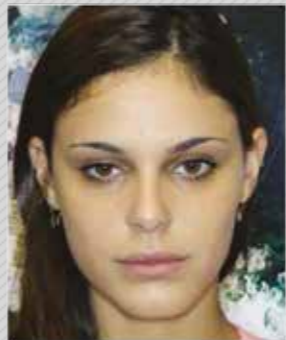
✗ רקע לא אחיד