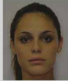
✗ כהה מדי