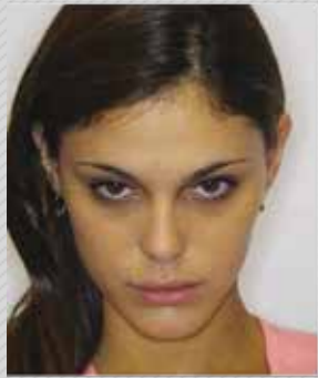
✗ מבט למטה