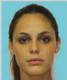
✗ רקע צבעוני