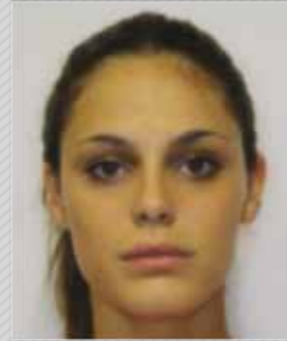
✗ חוסר מיקוד