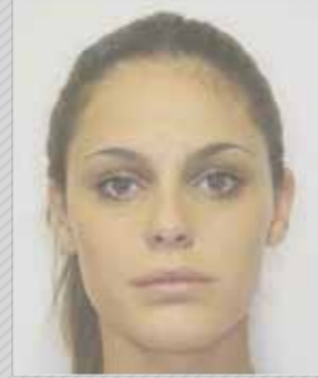
✗ בהיר מדי