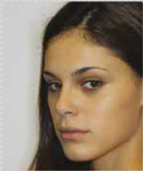
✗ מבט לצד