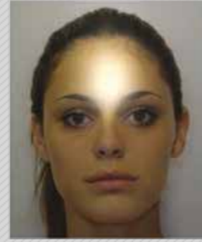
✗ חוסר בהירות