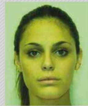
✗ חוסר איזון