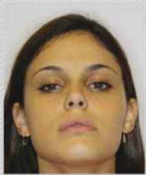
✗ מבט למעלה