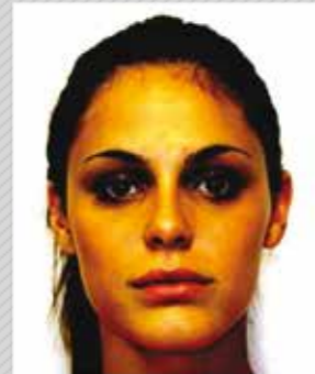
✗ ניגודיות יתר