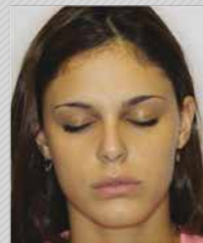
✗ עיניים עצומות