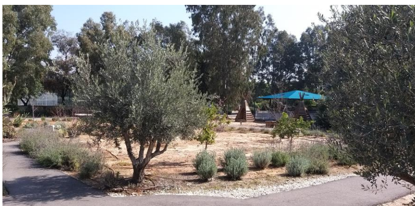
מסקיצות לגינה – הגינה הקהילתית בבית חולים מזור לבריאות הנפש