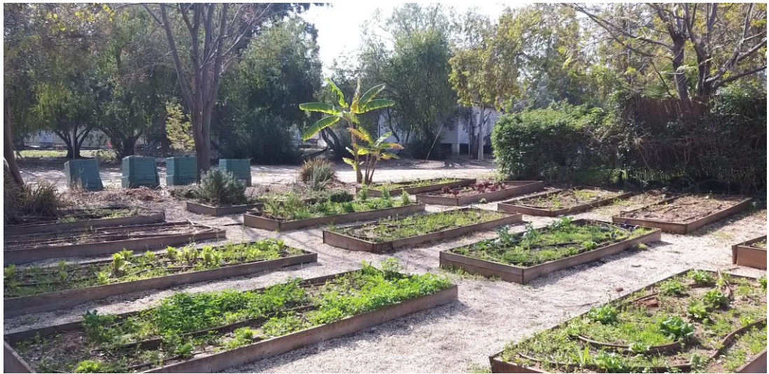
דוגמא לקו מלבני