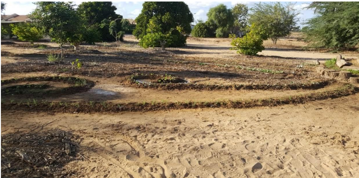
דוגמאות לקו עגול: ערוגות בקו מעוגל