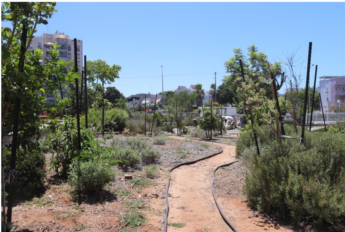
ציר הליכה ראשי בגינה קהילתית