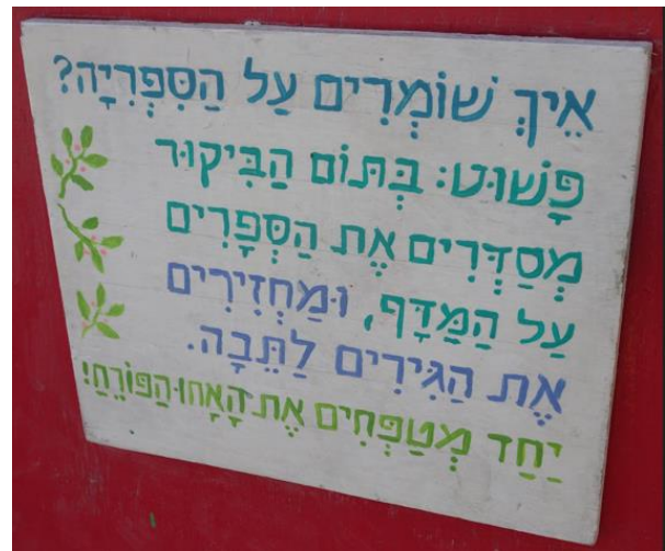
ספריה בגינה