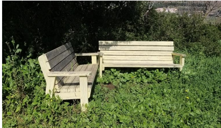
פינות ישיבה