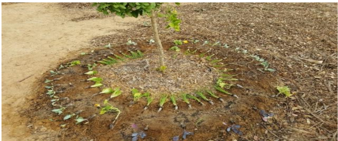
נטיעות ירקות סביב לעץ פרי