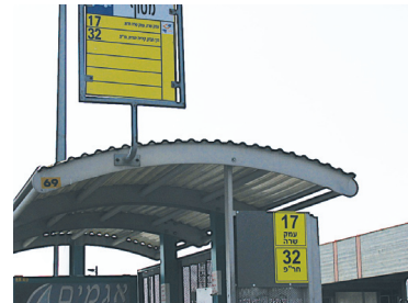
שילוט נגיש בכאר שבע (חברת מטרודן)