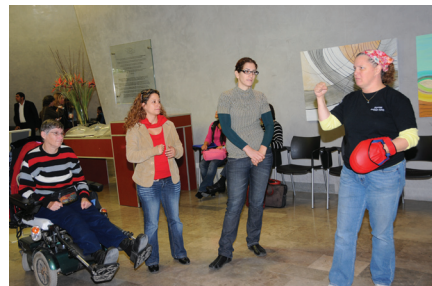
סדנת הגנה עצמית שהדריכה עמותת "אל הלב" ביום הכנס