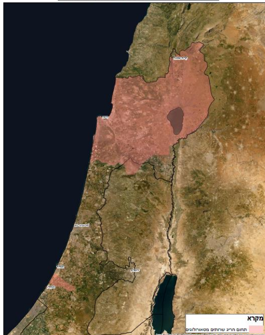
תיחום חריג לפי שרותים מטאורולוגיים

מפה 2 : תיחום שטחי החריגות לפרקי הזמן שנבחנו מבחינה הידרולוגית אזור הצפון, רמות מנשה ומישור החוף הדרומי 10/01/2020 עד 25/12/2019