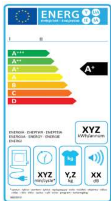
תווית אנרגיה למייבש כביסה מבוסס צינור פליטה (air vented)

רגולציית ה-Energy labeling למייבשי כביסה אשר בתוקף כיום היא EU 392/2012 . הרגולציה קובעת את דירוג האנרגיה של המוצר בהתאם ל-EEI שלו, ואת מתכונת תווית האנרגיה למייבשי כביסה, בהתאם לסוג המייבש – מבוסס עיבוי או מבוסס אוורור. סקאלת דירוג האנרגיה למייבשי כביסה כיום תחת רגולציה זו היא בין D - A+++ , כדלקמן: