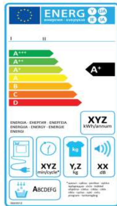
תווית אנרגיה למייבש כביסה מבוסס עיבוי (condenser)

ב-22.11.2023, פורסמה רגולציית Energy labeling חדשה למייבשי כביסה, EU 2023/2534 . הרגולציה החדשה, קובעת כי החל מה-01.03.2025 יש להציג את התווית החדשה לצד התווית הישנה. חובת הצגת התווית החדשה בלבד , תיכנס לפועל החל מ-01.07.2025.