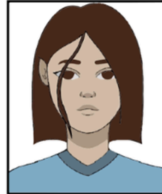
שיער על הפנים